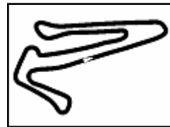
Adria Int Raceway 2.702 m