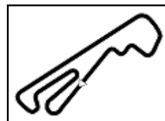
Autodr. dell'Umbria 2.507 m