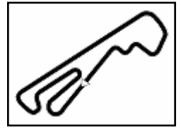
Autodr. dell'Umbria 2.507 m